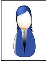
Sorumlu Hemşire Tülay İSTEGÜN