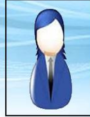
Enfeksiyon Hemşiresi Sevil ZAN KONUR